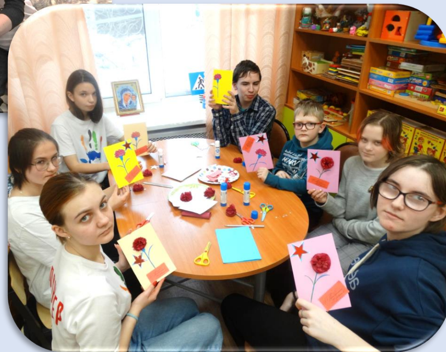
Поделки к празднику