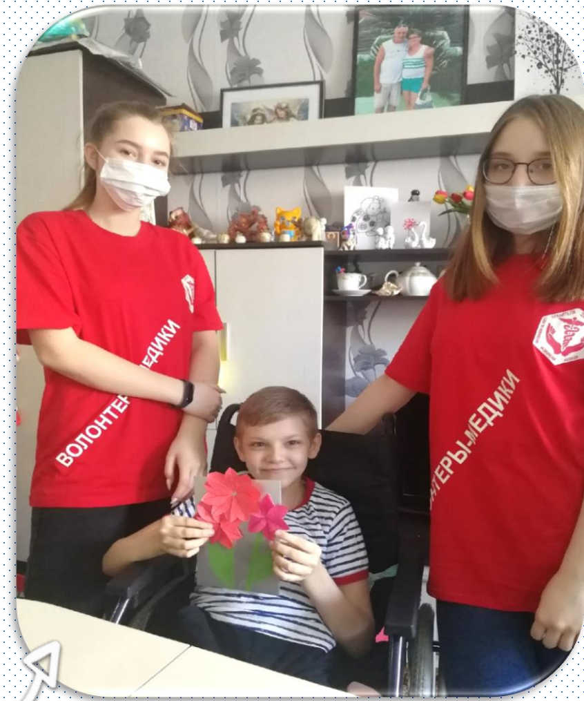
Готовим подарок бабушке