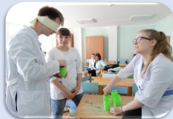
Проигрывание ситуации взаимодействия