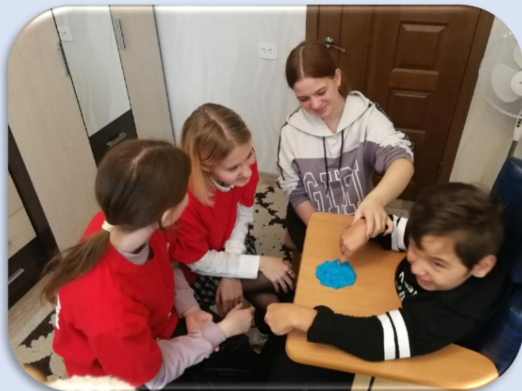
Новые встречи с друзьями