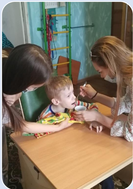
Практика «Социальная няня»