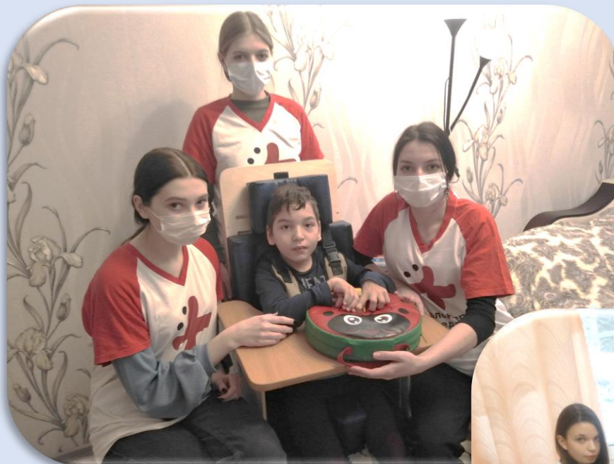
Развиваем моторику в играх