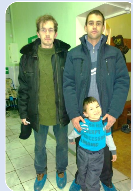
Сопровождение на мероприятия и реабилитацию